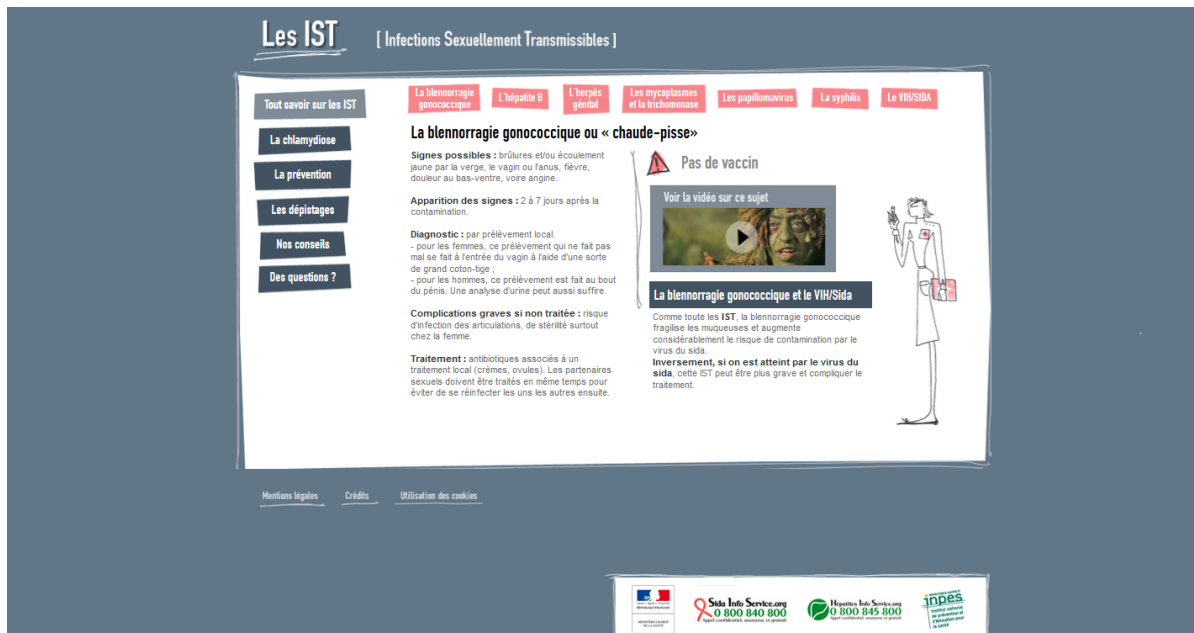
Website www.info-ist.fr. Inside page