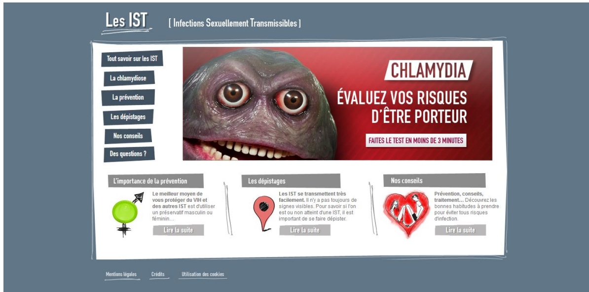
Website www.info-ist.fr. Homepage